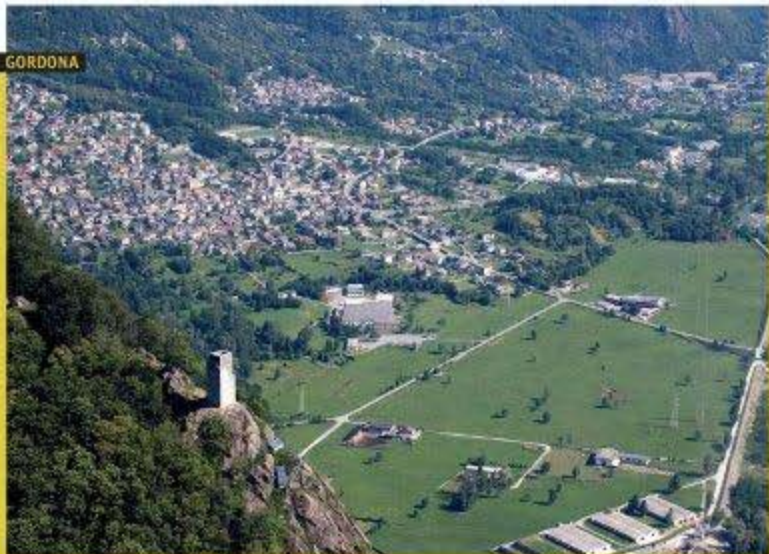
Gordona da San Pietro di Sogno